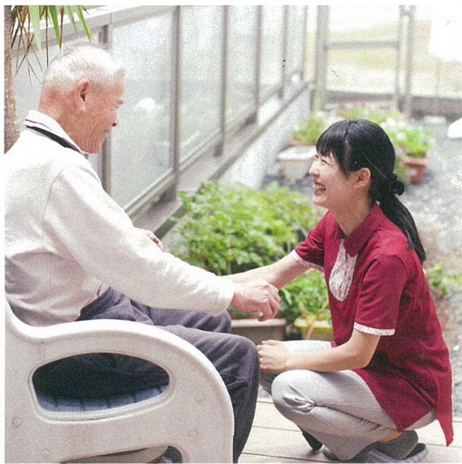
グループホームの敷地内にある畑を見ながら入居者と談笑。視線を合わせ、早口にならないようにわかりやすい言葉で話すことを心がけている。